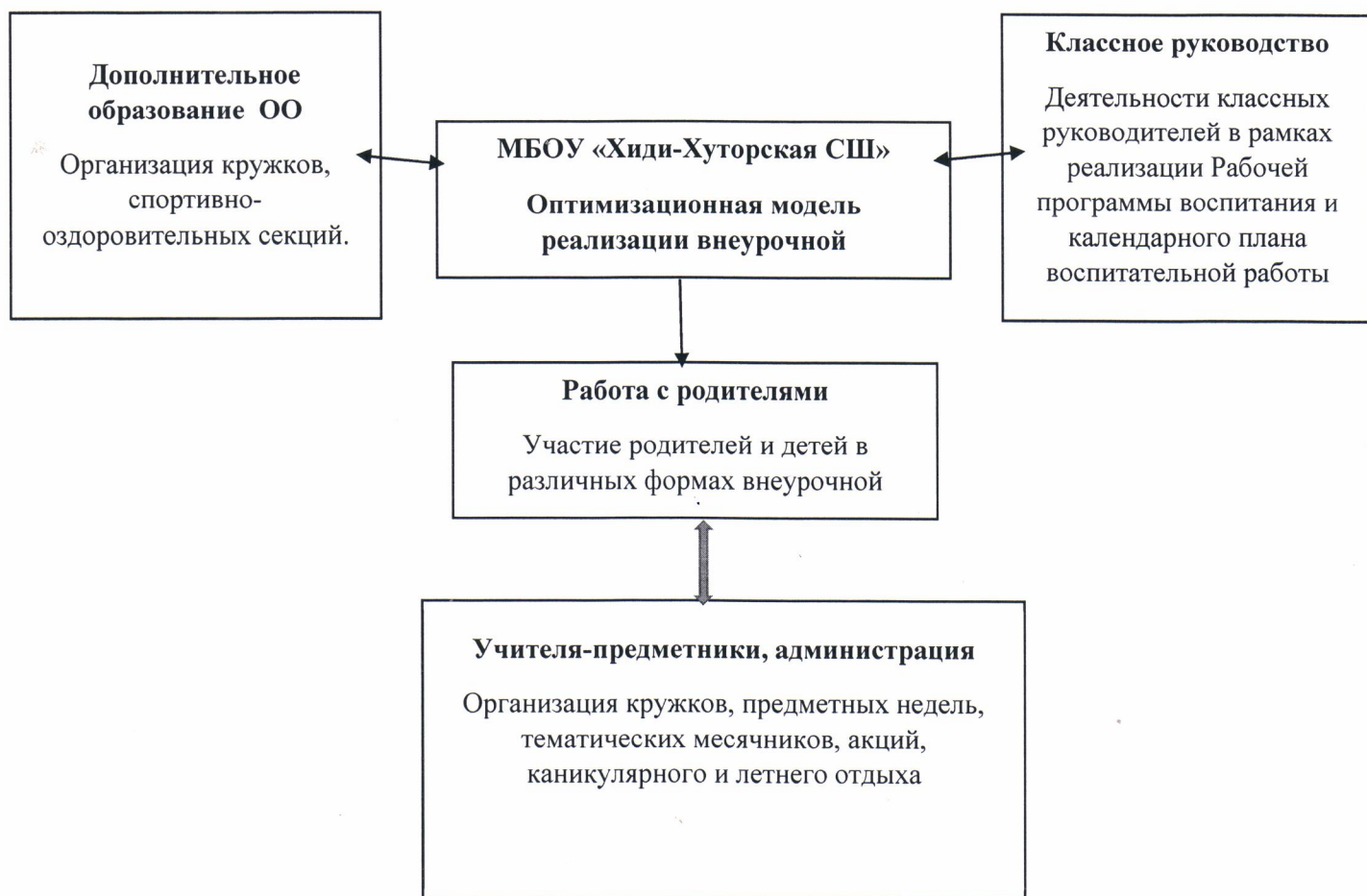
Схема Модели реализации внеурочной деятельности

Важно, чтобы достигаемые ребенком результаты были не только лично значимыми, но и ценными для социального окружения школы